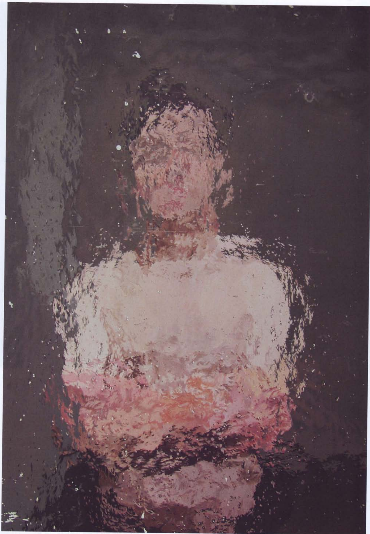
Homme debout, 2015, acrylique sur bois, 70 x 100 cm. Page de gauche : Ecce Homo, 2014, acrylique sur bois, 60 x 80 cm.