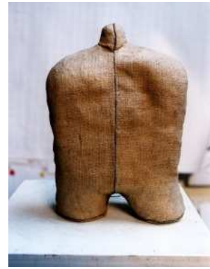
Sentinelle , Alain Quercia

L'exposition présente une œuvre passage, à la fois rétrospective et perspective pour l'artiste.