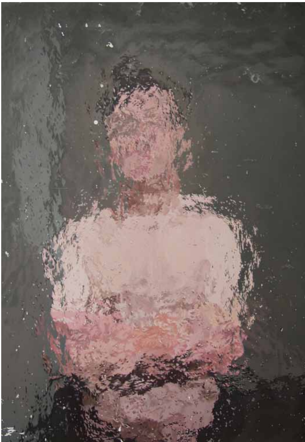
IA8 « Homme debout », acrylique sur bois, 100 x 70 cm, 2015