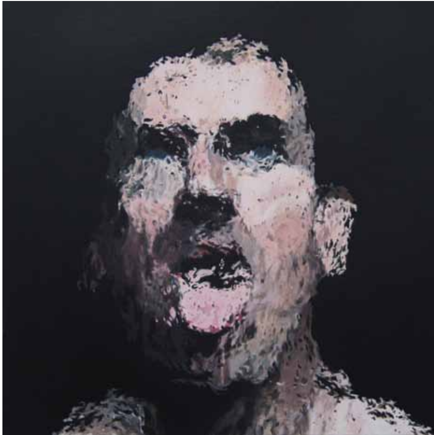
IA15 , acrylique sur papier marouflé sur bois, 20 x 20 cm, 2015