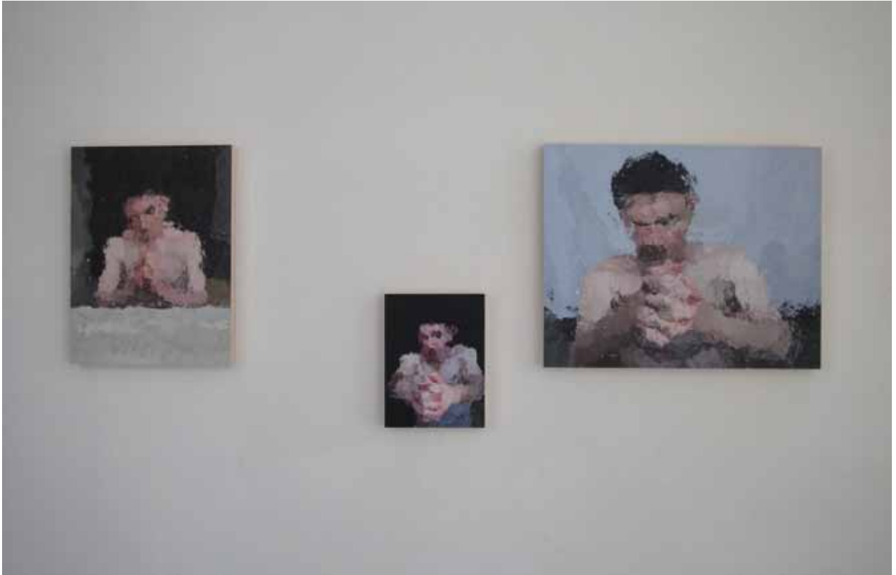
Galerie Deneulin 2016