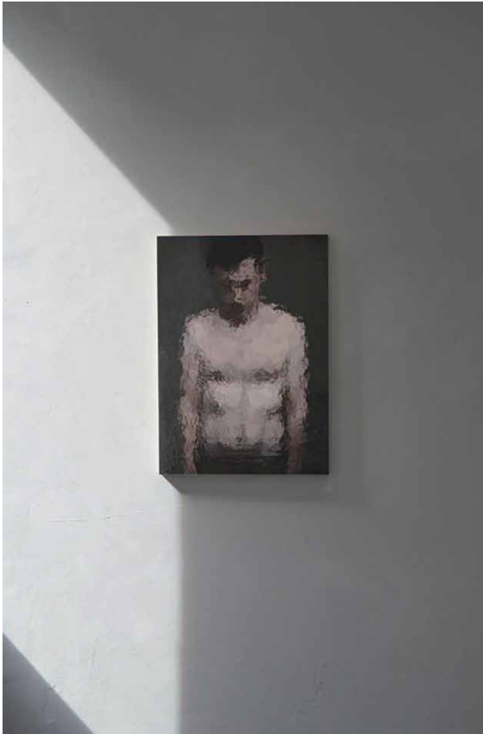
Galerie Deneulin 2016