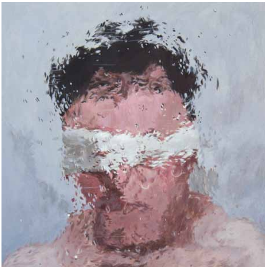
IA11 , acrylique sur papier marouflé sur bois, 20 x 20 cm, 2015