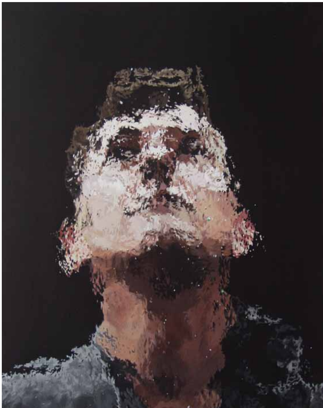
IA18, acrylique sur papier marouflé sur bois, 40 x 30 cm, 2016