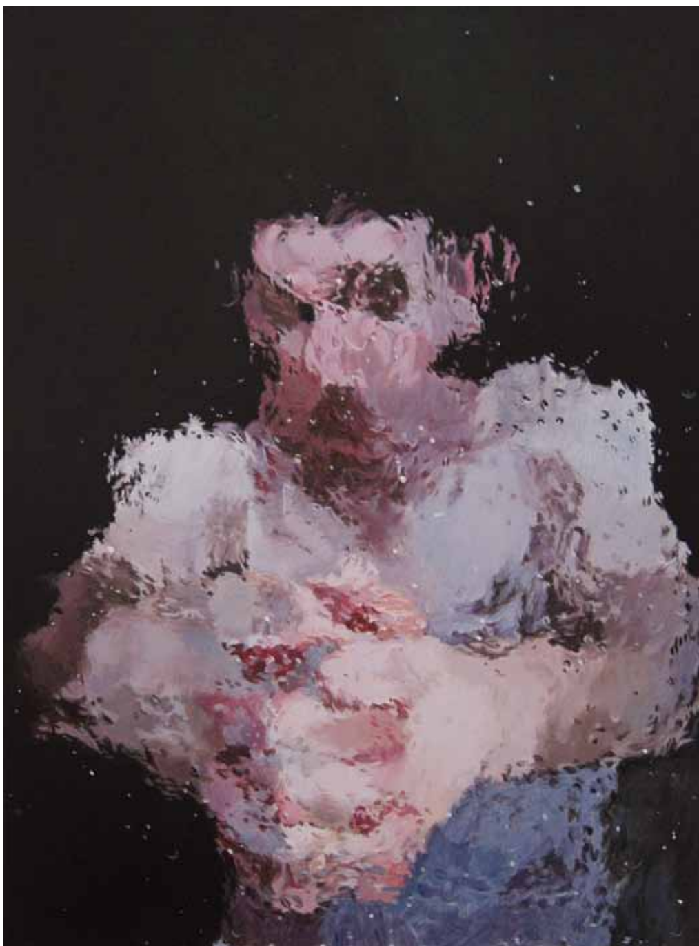
IA14, acrylique sur papier marouflé sur bois, 18 x 24 cm, 2015