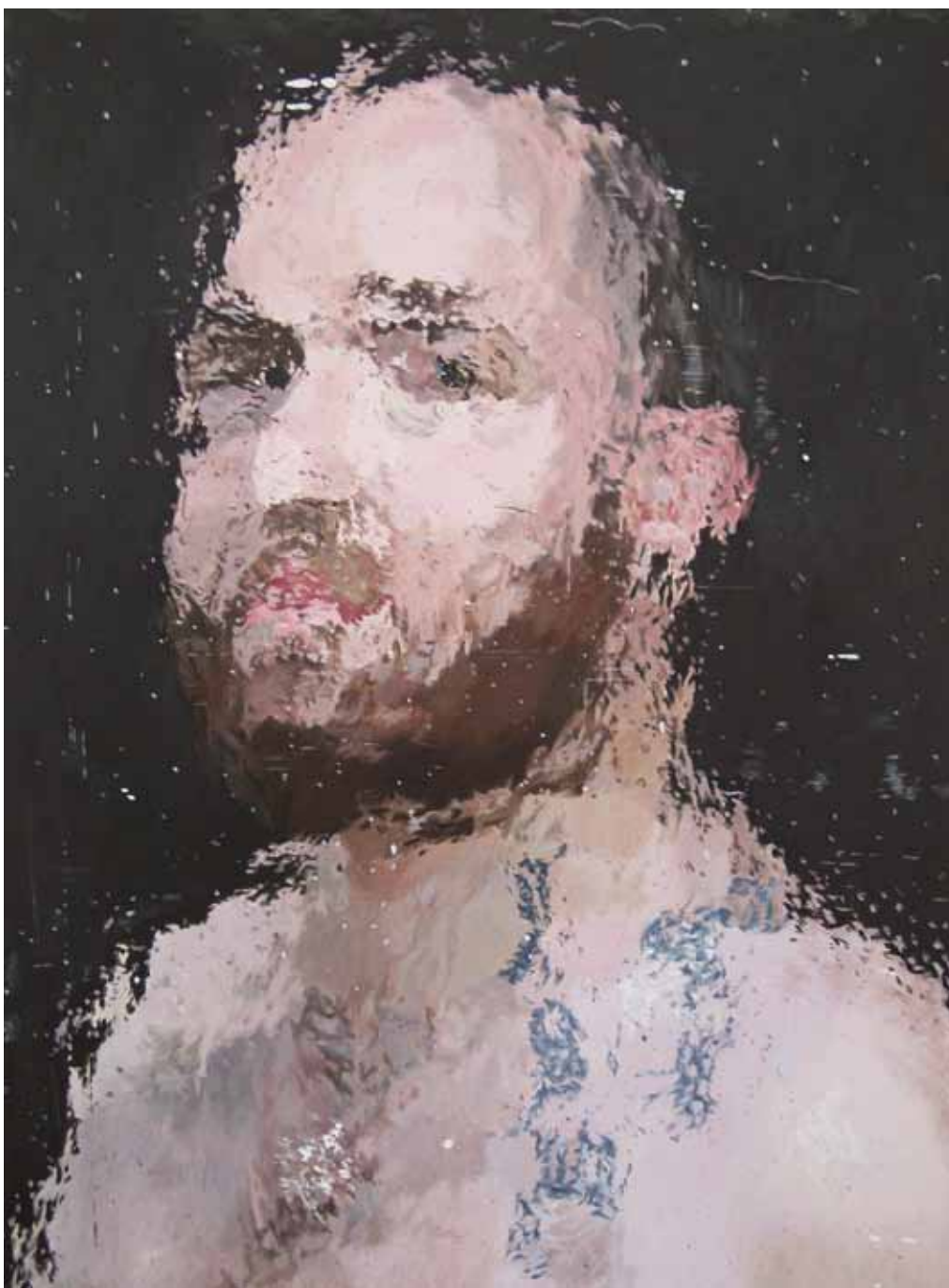
IA7 « Le jeune homme tatoué à la perle », acrylique sur papier marouffé sur bois, 40 x 30 cm, 2015