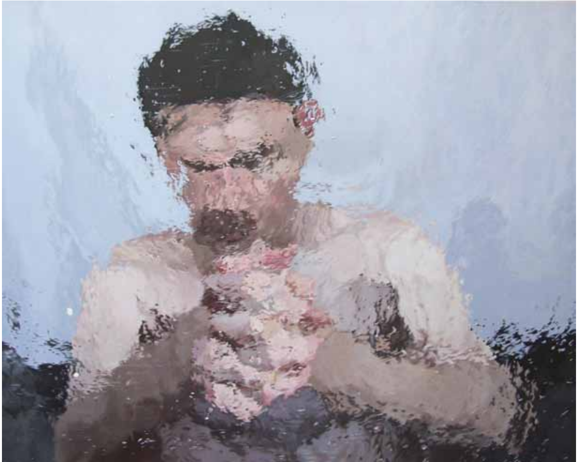
IA10 , acrylique sur bois, 40 x 50 cm, 2015