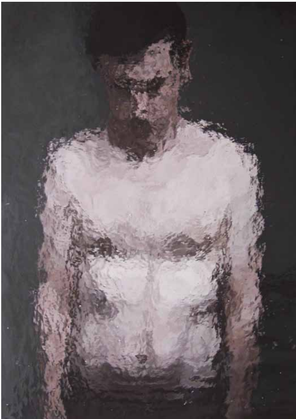
IA17, acrylique sur bois, 70 x 50 cm, 2016