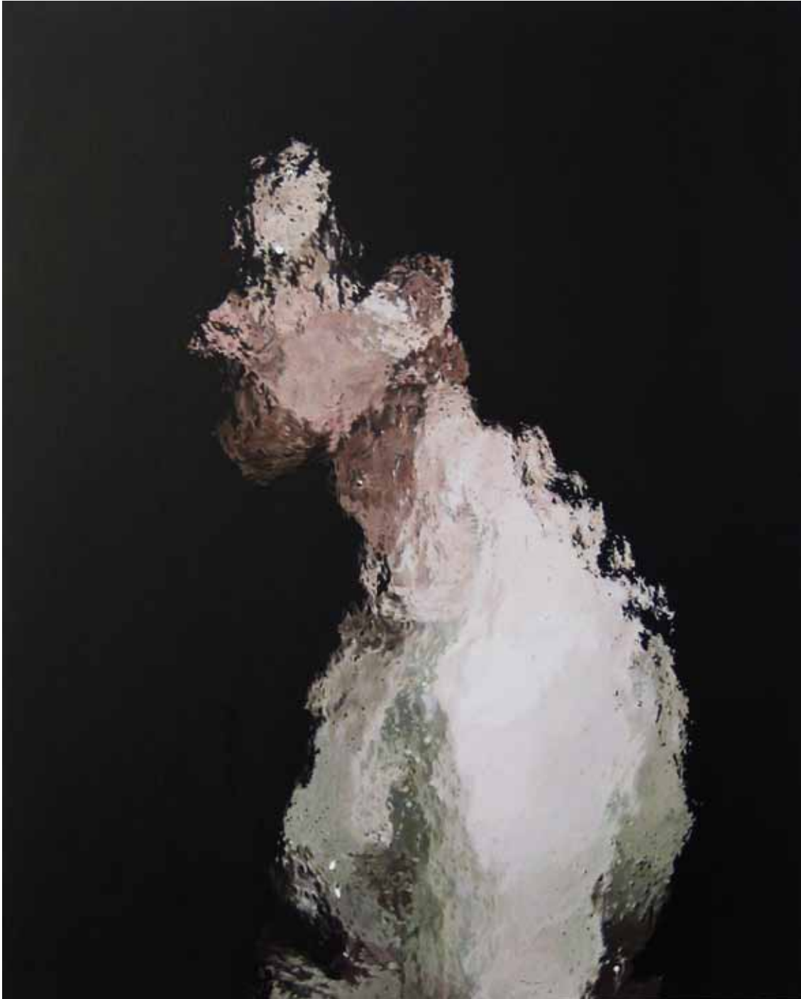
IA16 « Profil », acrylique sur papier marouflé sur bois, 50 x 40 cm, 2015