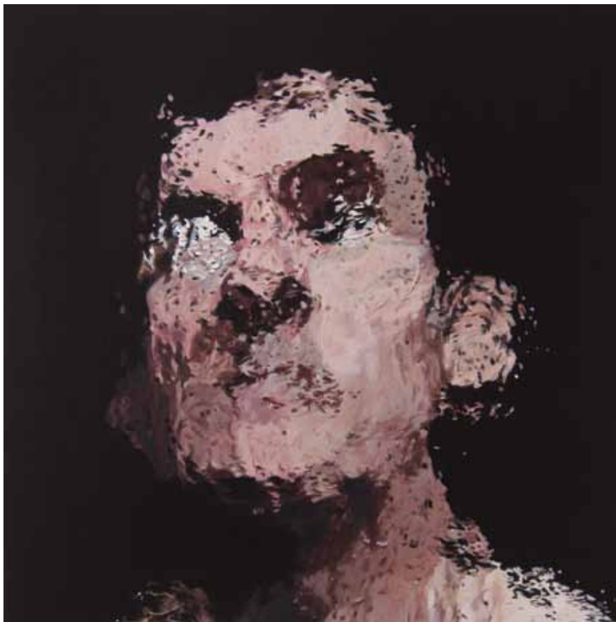
IA19 , acrylique sur papier marouflé sur bois, 20 x 20 cm, 2016