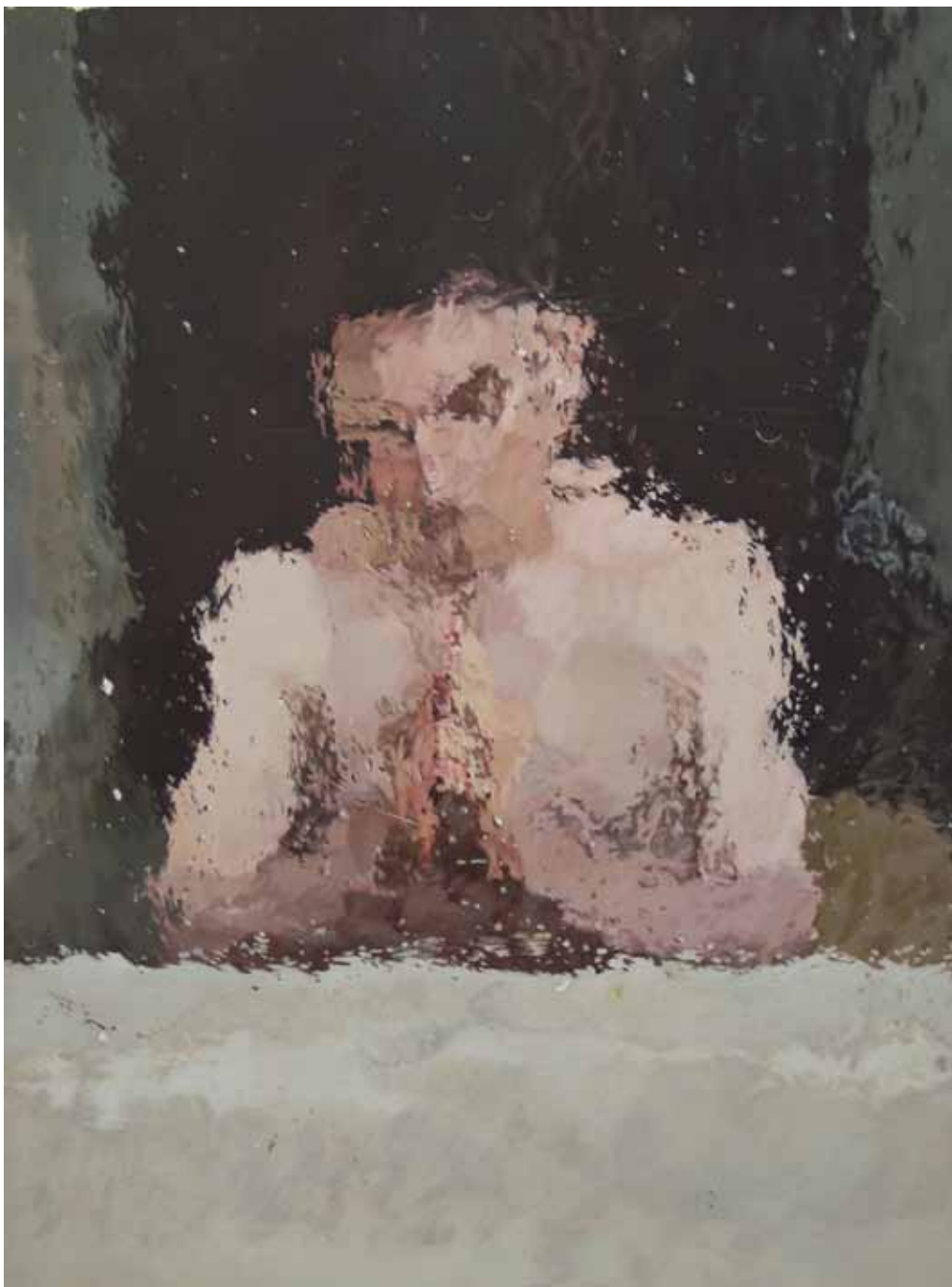
IA9, acrylique sur papier marouflé sur bois, 40 x 30 cm, 2015