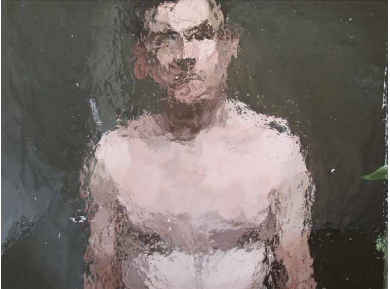
IA4 « Ecce homo », acrylique sur bois, 60 x 80 cm, 2014